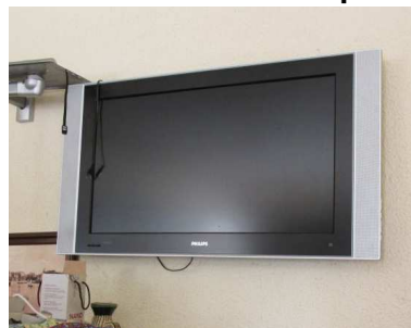
Ad 13 TV LCD 37 Philips