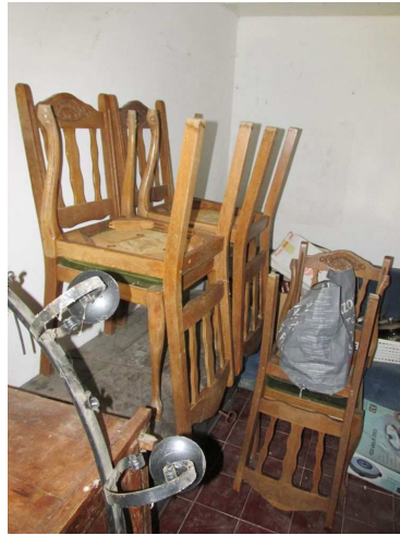
Ad 2 Sjedalice