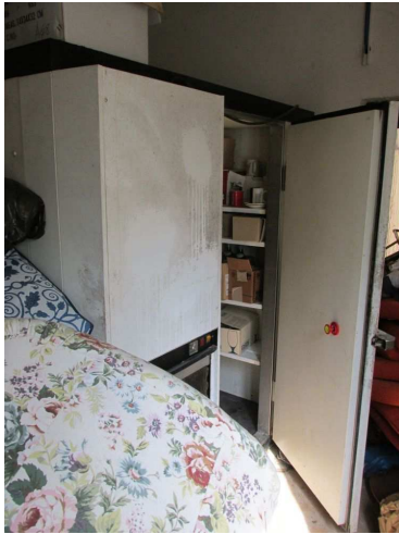
Ad 1 Velika rashladna komora