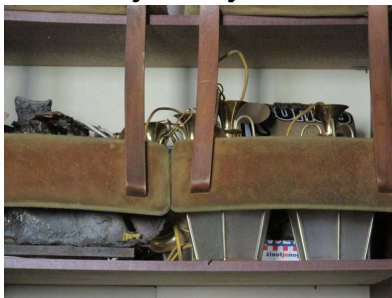
Ad 8 Rasvjetna tijela