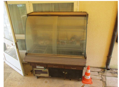
Ad 5 Vetrina